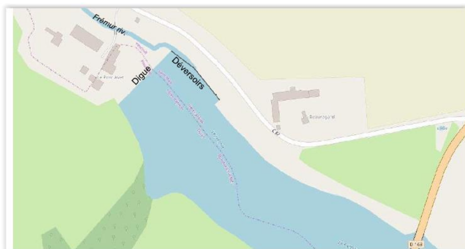
Retenue de PontAvet

-des travaux d'urgence ont été réalisés en décembre 2018-janvier 2019 : le niveau de la retenue a été abaissé d'environ 2 m (mise en place d'un siphon pour ce faire), et la hauteur des déversoirs formant l'évacuateur de crue a été abaissé de 60 cm. Le siphon installé sera disponible pour les travaux envisagés à l'automne 2020. Après la baisse du niveau de la retenue, les infiltrations constatées au niveau du parement aval ont cessé.