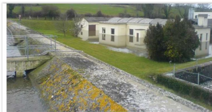
Barrage de Pont Avet