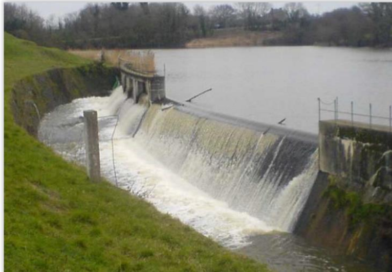
Déversoirs en rive droite (évacuateur de crues)